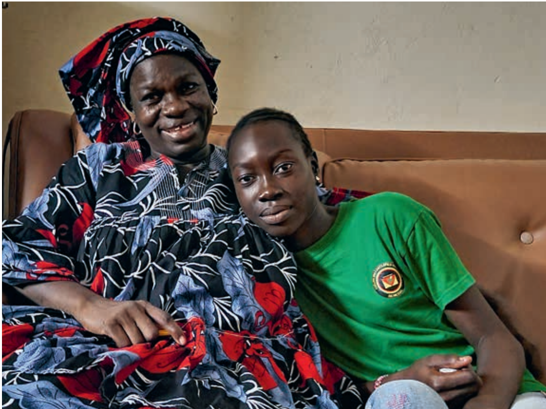
Das Foto zeigt Adama mit ihrer Nachhilfelehrerin.

Mit 50 Euro kann eine Gastfamilie ein Kind einen Monat lang versorgen.