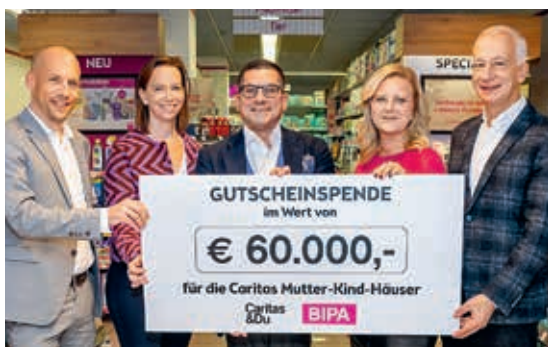
Danke für 15 Jahre Engagement für Mütter und Kinder in Not!