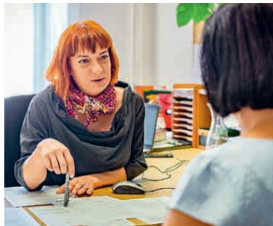
Danke an The Coca-Cola Foundation für die Unterstützung der Integrationsprojekte der Caritas.

Die The Coca-Cola Foundation unterstützt auch heuer wieder Integrationsprojekte der Caritas. Die Spende in Höhe von 150.000 USD ermöglicht geflüchteten Menschen in Österreich eine bessere wirtschaftliche Integration. Ein besonderer Fokus liegt dabei in der Vermittlung in Pflegeberufe, da hier besonderer Fachkräftemangel herrscht. Somit profitieren nicht nur Projektteilnehmer*innen, sondern auch das Pflege- und Gesundheitssystem von dieser Unterstützung. Danke!